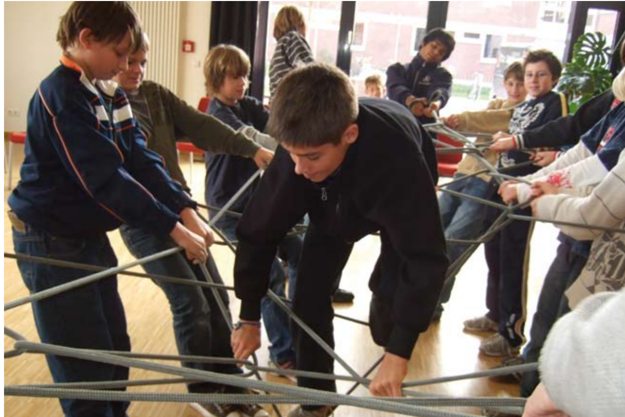
„Jungenarbeiter brauchen ein offenes Herz und offene Ohren“