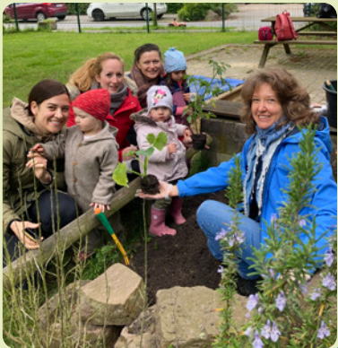
Eltern-Kind-Gruppe am Montag