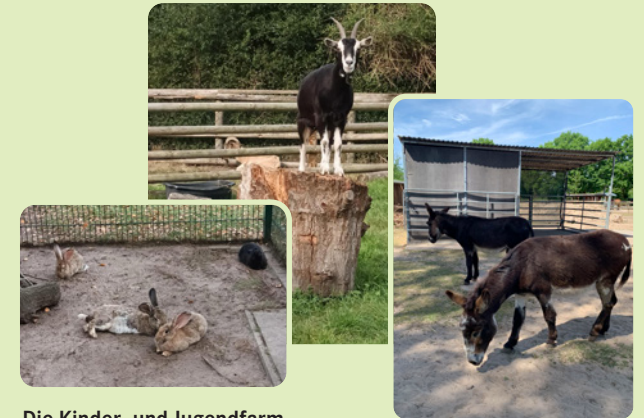
Die Kinder- und Jugendfarm auf dem Gelände der Hans-Wendt-Stiftung