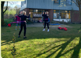
Eltern-Kind-Gruppe am Freitag