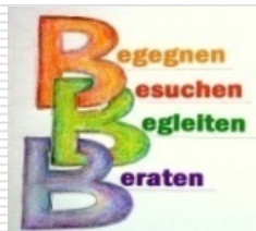
Modellprojekt „Aufsuchende Altenarbeit/Hausbesuche“